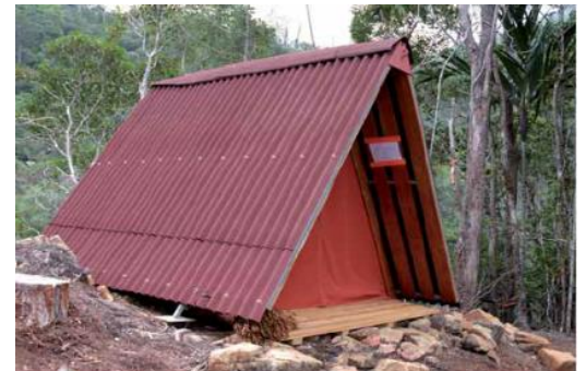
Abri de sécurité (DZ de la Corne du Diable)

Shelter : They are placed on the sixth step for safety reasons (DZ of the second Devil's Horn and the Fougères camp). Free, 4 places to sleep.